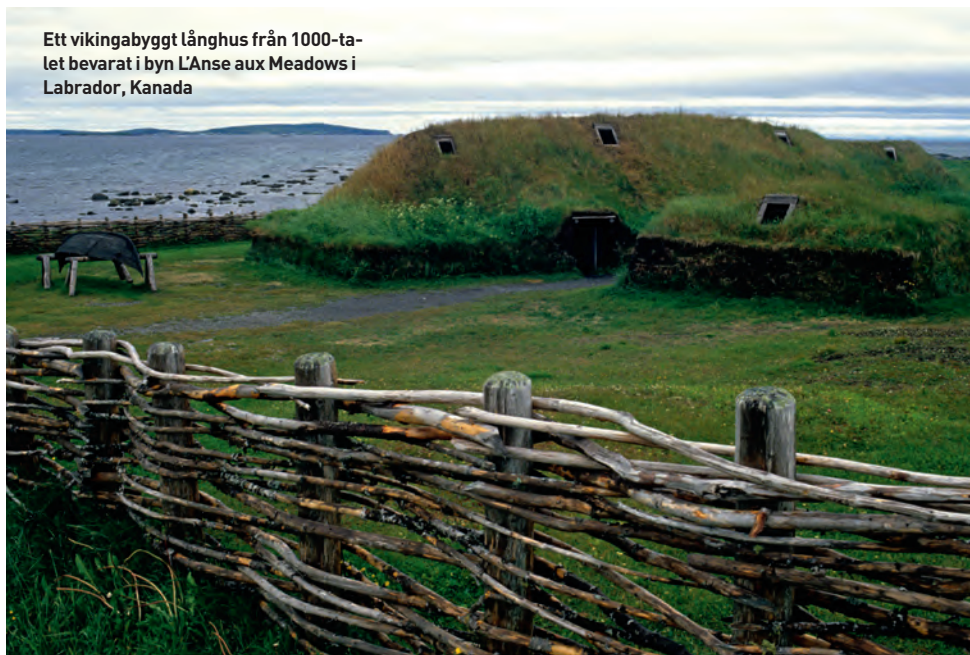
Ett vikingabyggt långhus från 1000-talet bevarat i byn L'Anse aux Meadows i Labrador, Kanada