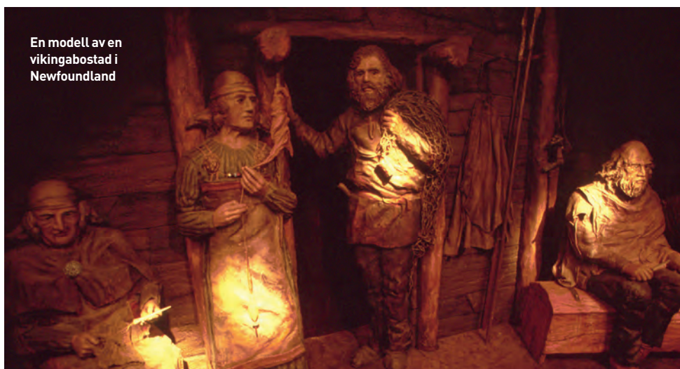
En modell av en vikingabostad i Newfoundland

tillsammans med fler enstaka nordiska föremål, bland annat en del av en våg i nordligaste delen av Kanada.