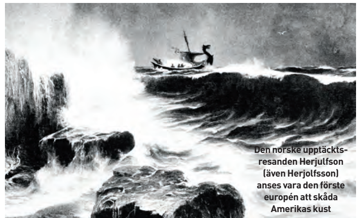
Den norske upptäcktsresanden Herjulfson (även Herjolfsson) anses vara den förste europén att skåda Amerikas kust

Nordbornas Grönland var en fristat fram till 1261 då folket på tinget beslutade sig för att underställa sig den norska kronan. Det var en regelbunden trafik mellan Europa och Grönland. Valrossbetar – nordbornas elfben – var en lyx på sydligare breddgrader. Men under slutet av 1300-talet började fartygen komma allt mindre tätt, och uppgifterna om Grönlandshandeln blev allt glesare i dokumenten, för att upphöra helt under 1400-talet. Ingen vet hur många som bodde där, men antagligen rörde det sig om runt 5 000 personer. De levde precis som de gjort så många mil därifrån – på boskapsskötsel, fiske och jordbruk. Skeppen som anlände till Grönland var lastade med järn och kläder – och med sig tillbaka hade de ull, pälsar, valrossbetar och isbjörnsungar. Sydeuropéernas ökade och billiga handel med elfben i kombination med den ökade konkurrensen om skinnhandeln från Ryssland, bidrog med största sannolikhet till att